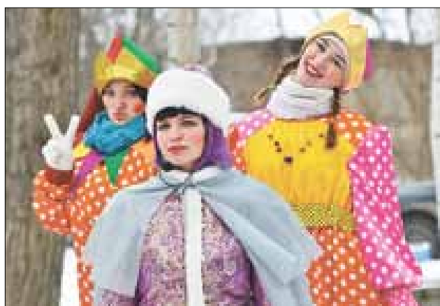
■ «Студеные заигрыши Архангельского Снеговика» собрали и детей и взрослых