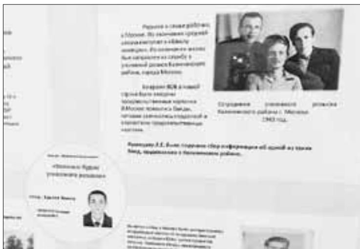
■ В музее представлены работы детей и подростков, посвященные их героическим предкам.