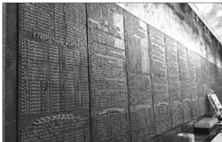
■ На бронзовых досках, размещенных вокруг Зала Памяти и Скорби, перечислены все воинские формирования, участвовавшие в Великой Отечественной войне.

Знание таких подробностей жизни в роковые сороковые, о которых пишут ребята, – лучшее свидетельство того, что к сохранению памяти в семьях относятся трепетно. А это значит, что все эти герои останутся не только в архивах музеев, но и в сердцах следующих поколений.